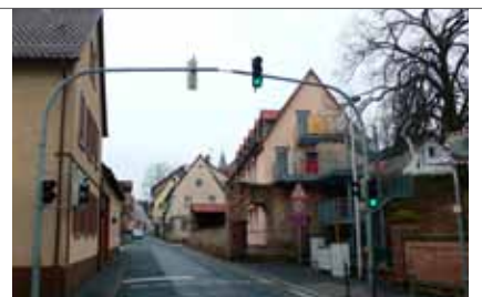
Am Kirchberg von Osten