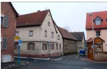
Ecke Am Kirchberg/Grabenstraße