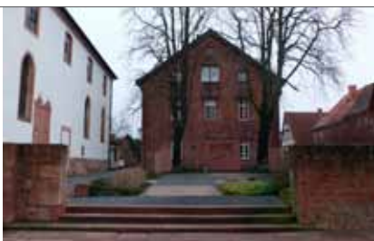
Bücherei von Westen