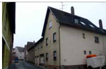
Grabenstraße von Osten