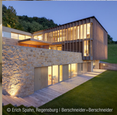
© Erich Spahn, Regensburg | Berschneider+Berschneider