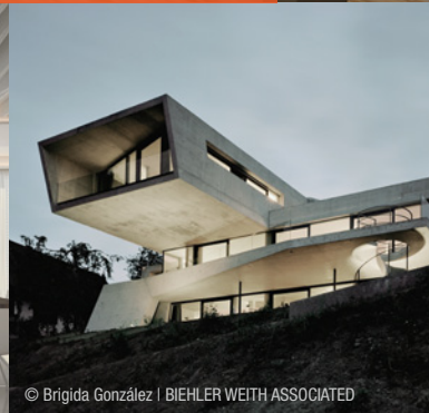
© Brigida González | BIEHLER WEITH ASSOCIATED