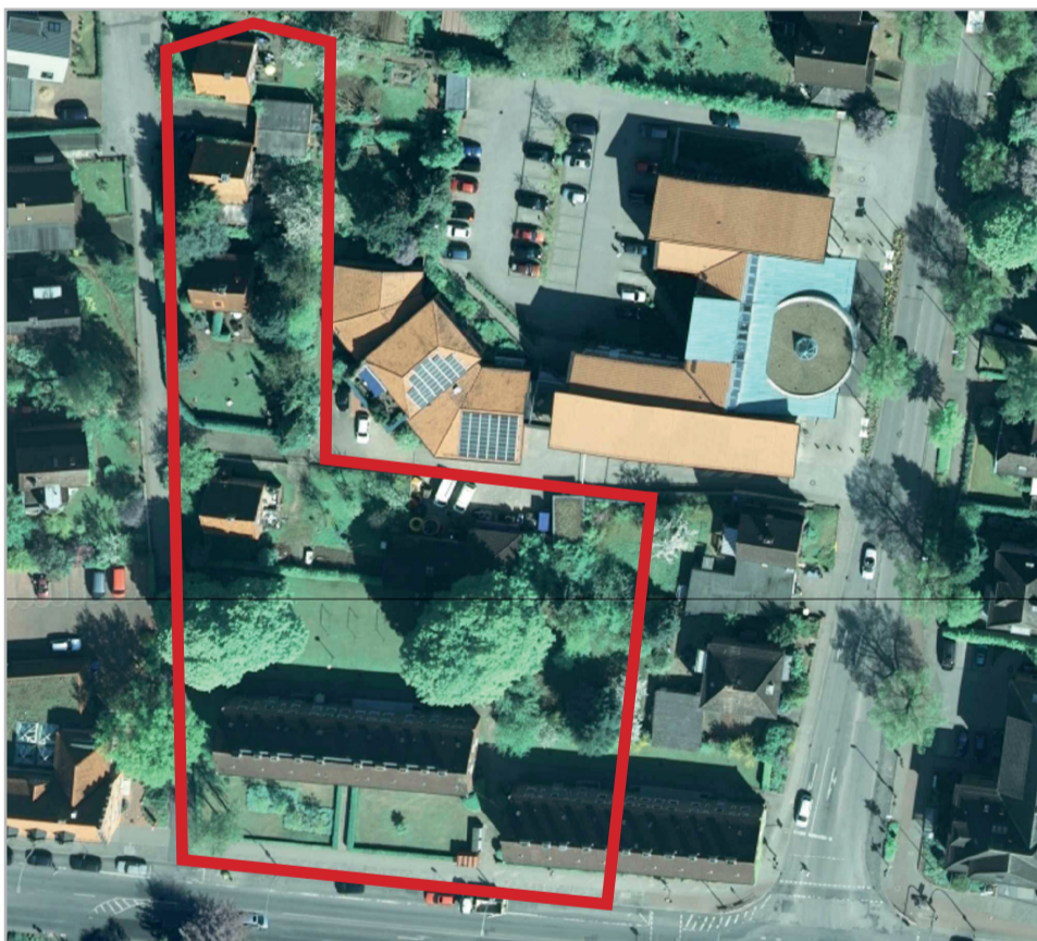
Luftbild mit Abgrenzung der Vermarktungseinheit, rote Linie